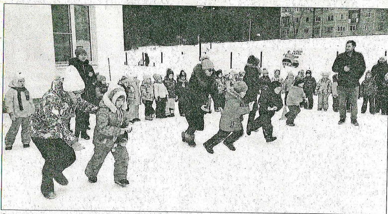
Сразу восемь команд участвовали в игре.