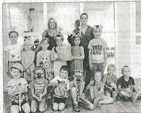
Участники мероприятия со своими педагогами.

Мероприятие, посвященное пожарной безопасности, прошло 16 июля в детском саду №17/1. Провели его Е.А. Рыбина и Г.Ю. Кузнецова.