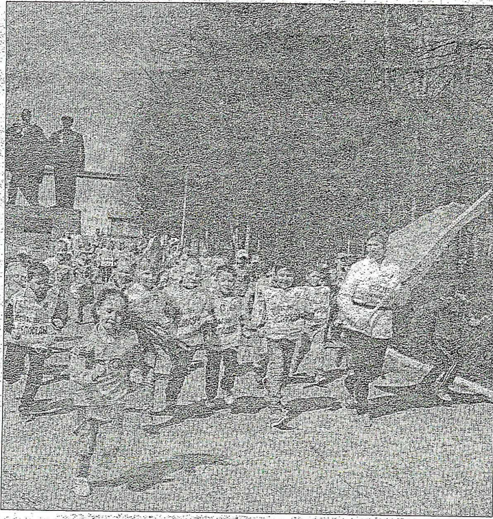
На старт пробег вышли 8 команд дошкольников.

Елена КОРЕНЬКОВА, инструктор по физкультуре детсада №39