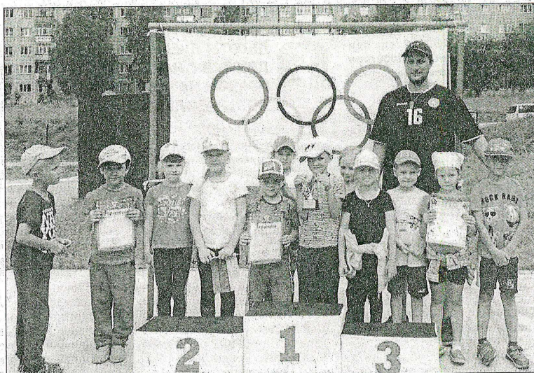
Призеры игр у олимпийского пьедестала.

Выражаю благодарность всем педагогам и родителям за участие детей в соревнованиях! И, конечно же, поздравляю победителей и призеров!