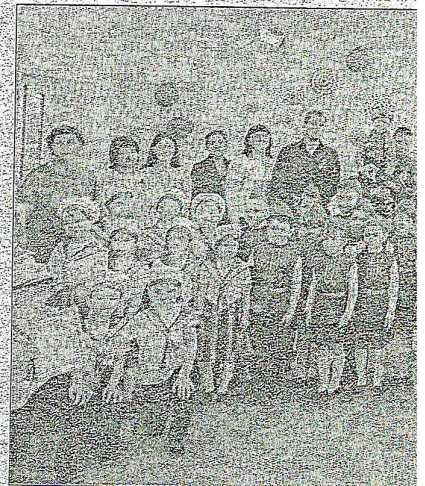
Участники смотра строевой песни среди

Облаченные в костюмы выб- войск, дошкольники называют ко-