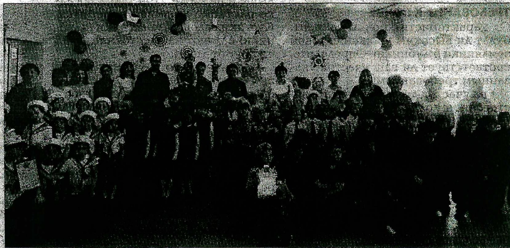
Участники смотра строевой песни среди воспитанников детских садов.

Всем участникам конкурса были вручены сладкие призы и благодарности за участие, лучшие были отмечены дипломами победителей и лауреатов.