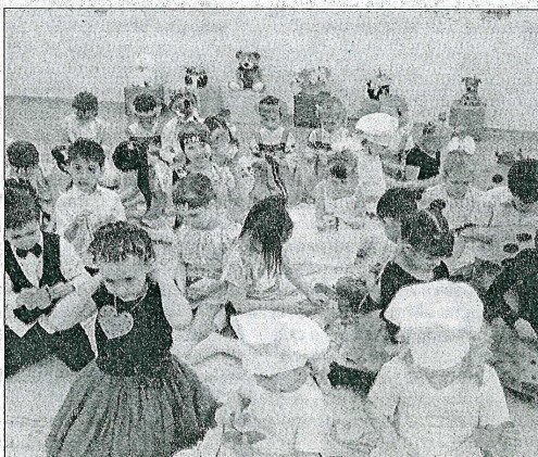
После конкурса дети изготовили своими руками сердечки-сувениры и забрали их с собой.